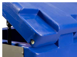
Charnière pleine longueur intégrée