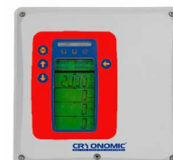
Détecteur CO 2