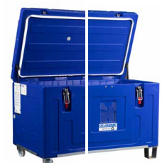
Pieds en acier interchangeables ou 4 roues pivotantes (avec 2 freins)