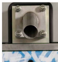
Changement rapide de matrice avec 4 boulons