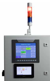
Pelletiseur, balance et détecteur CO 2 peuvent être contrôlés par une télécommandeur