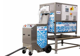
Machines de nettoyage cryogénique peuvent être remplies directement avec la glace sèche