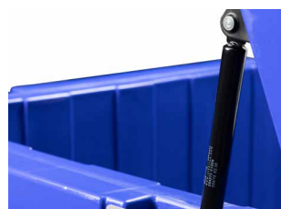
Ouverture du couvercle assistée par des vérins pneumatiques