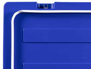
Joint en silicone hygiénique